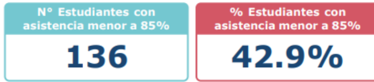
Gráfico 2.1: Distribución (y número) de estudiantes del establecimiento según su rango de asistencia 2023: